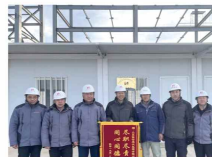
40000吨/生物法发茆二酸建设项目