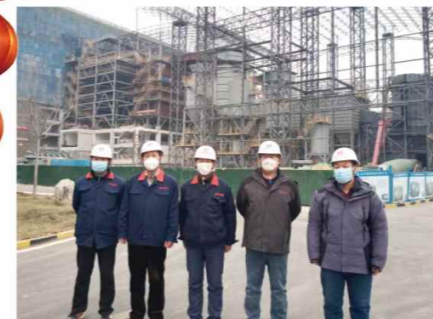
章丘区生活垃圾焚烧发电项目